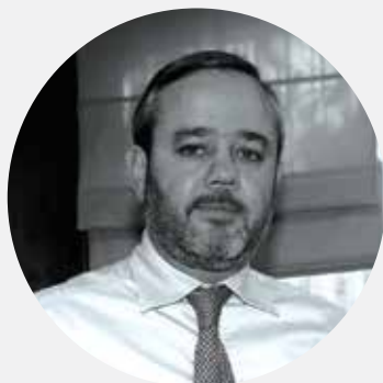
Bruno Baranda F. Ministro de Desarrollo Social