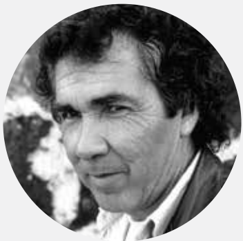
Hernán Rivera Letelier Escritor