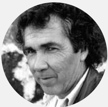
Hernán Rivera Letelier Escritor