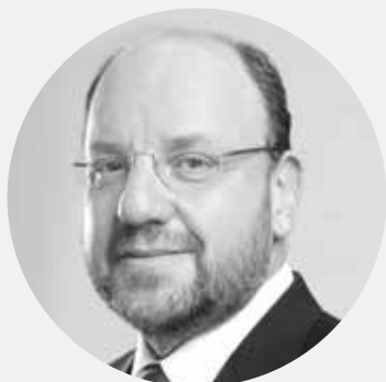
Alfredo Moreno Ch. Ministro de Relaciones Exteriores

Se entrega a instituciones o personas que desde su ámbito han realizado un aporte extraordinario, significativo y evidente al desarrollo del país y su gente. En esta oportunidad se otorgará al Ministro de Relaciones Exteriores y a Bomberos de Chile.